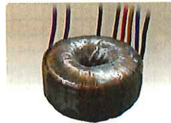
トロイダルトランス