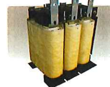
大電流用リアクトル