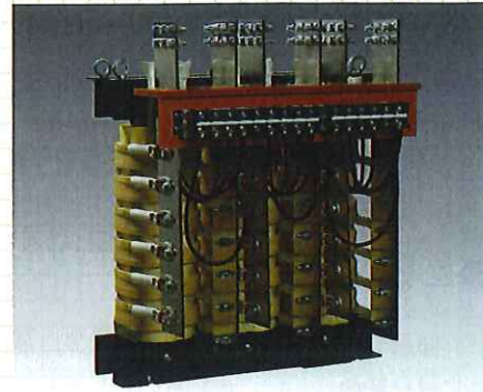
大電流用トランス